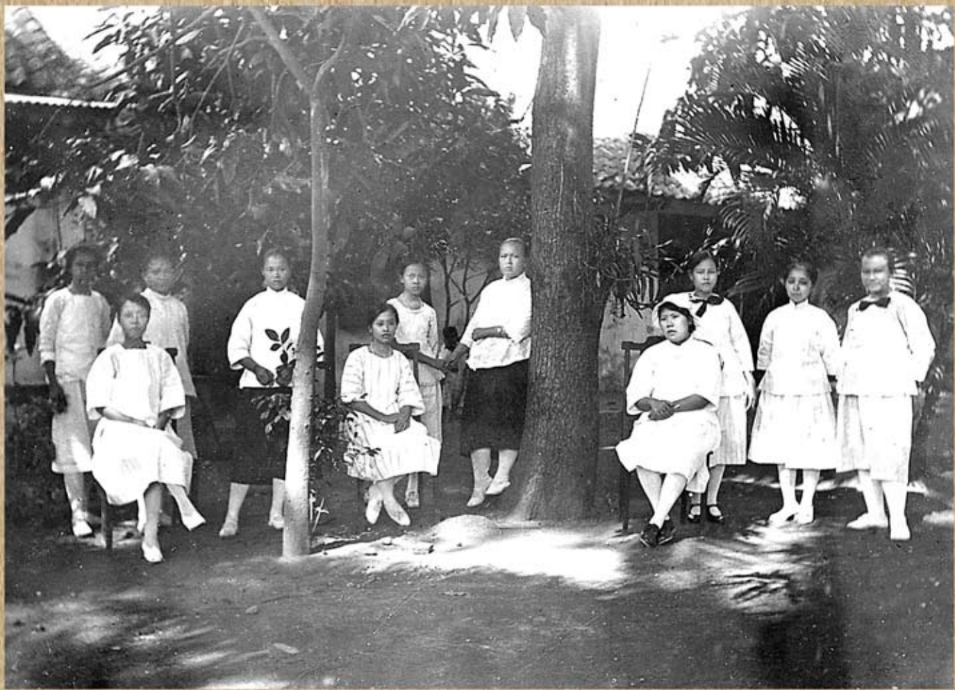
1923年中華女學校學生影於校內。右三站立者為我母親。