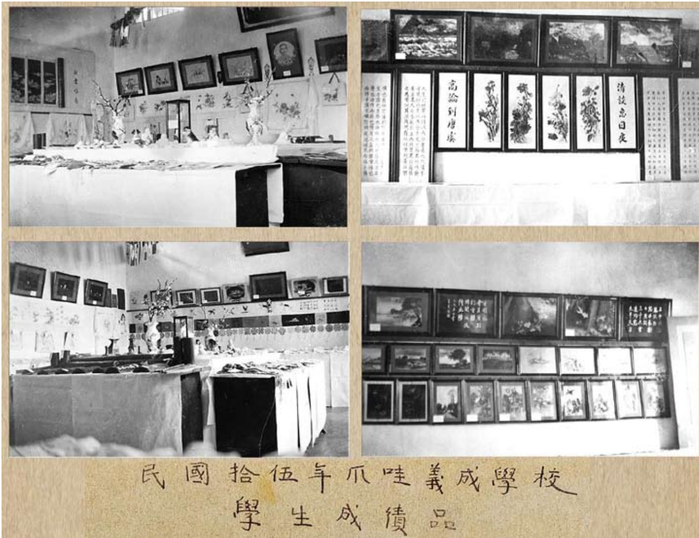
1926年義成學校學生成績品展覽。